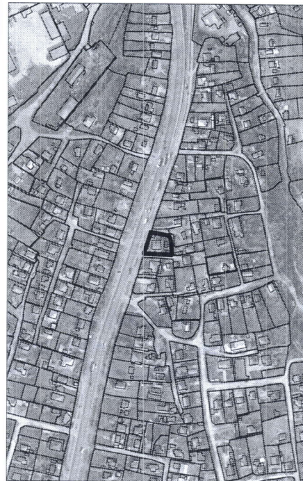
124 - numărul cadastral al terenului 01 - numărul cadastral al clădirii