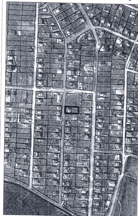
544 - numărul cadastral al terenului 01 - numărul cadastral al clădirii