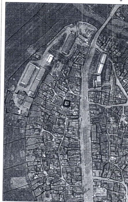
120 - numărul cadastral al terenului 01 - numărul cadastral al clădirii